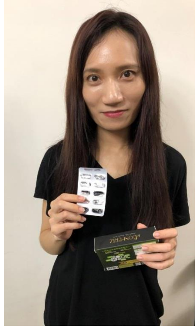
【圖七/成果分享使用碧容健®機能松】