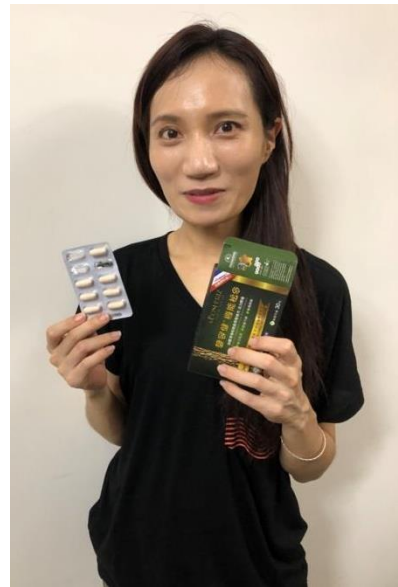
【圖六/正在使用碧容健®機能松】

深信：找到適合自己的保養方式， 加上正確的保健習慣，一定可以提升免疫力讓自己更健康和充滿活力。 因此，極力推薦~碧容健®機能松！