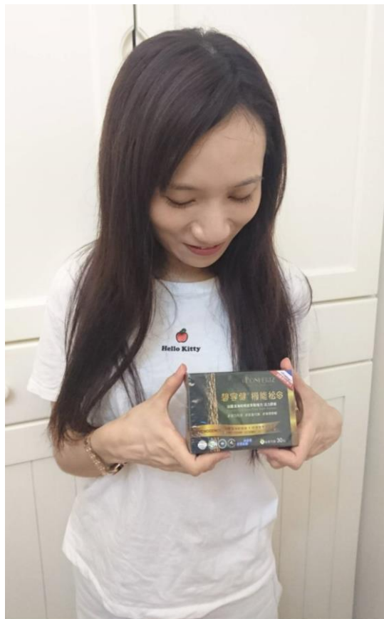
【圖一/碧容健®機能松產品外觀&實體大小】